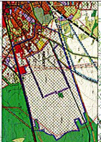
GRANICE OBSZARU OBJĘTEGO PROJEKTEM PLANU MIEJSCOWEGO